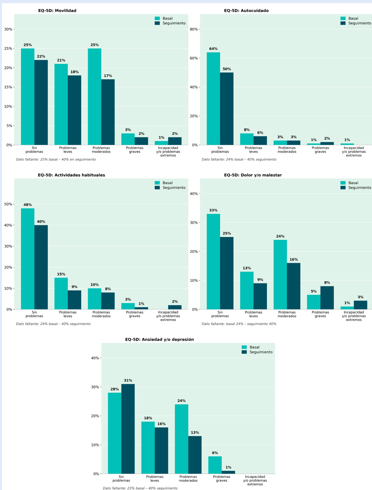
Figura 2. Score EuroQol EQ-5D-5L en sus 5 dimensiones pre y pos-TAVI (N=120).